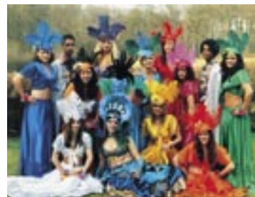
Dance Group Naomi